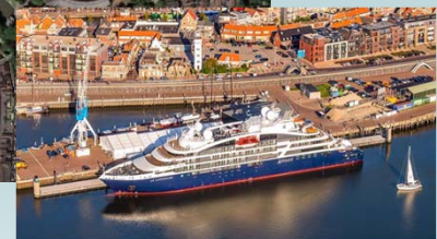
Nautic traffic crosses into the voorhaven